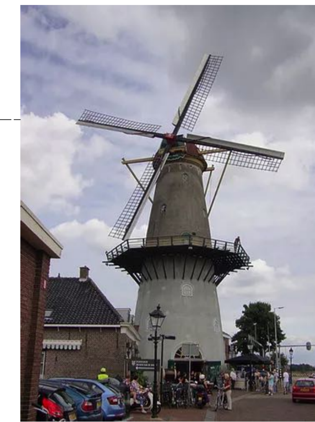
ZICHT OP DE MOLEN

Adres: Noordeinde (nummer(s) niet toegekend) Postcode: code(s) niet toegekend Plaats: Spijkenisse Sectie: E Perceelnummers: 6737, 1843 en 5021 Kadastrale gem.: Nissewaard