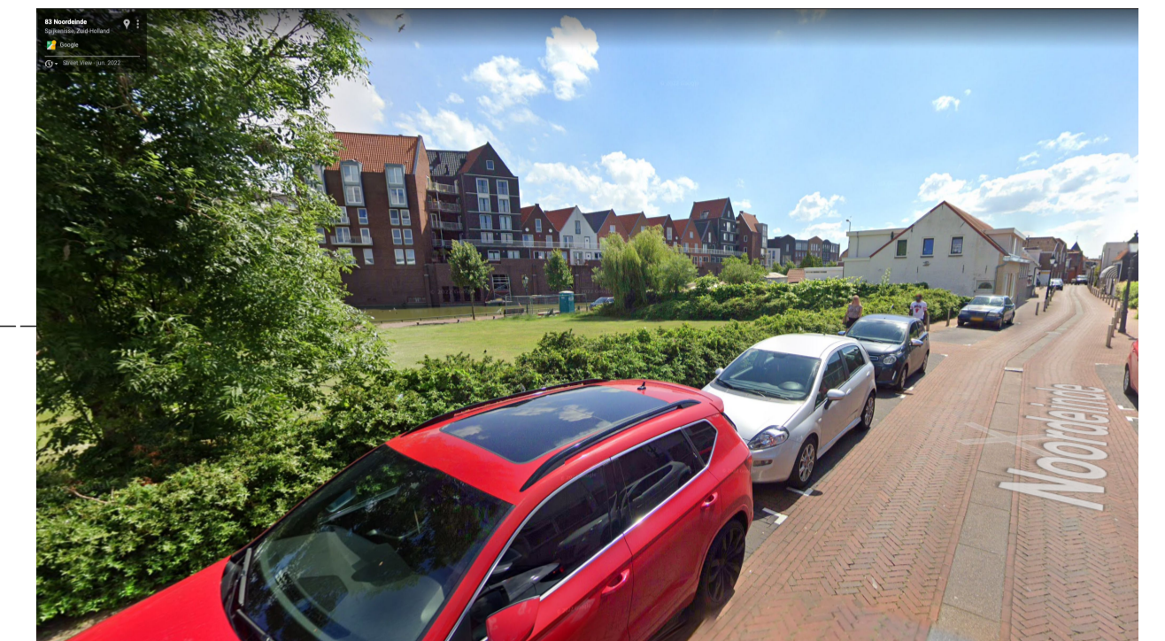
ZICHT VANAF NOORDEINDE