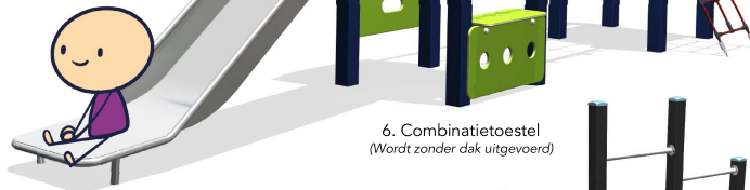
6. Combinatietoestel (Wordt zonder dak uitgevoerd)