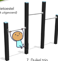
7. Duikel trio